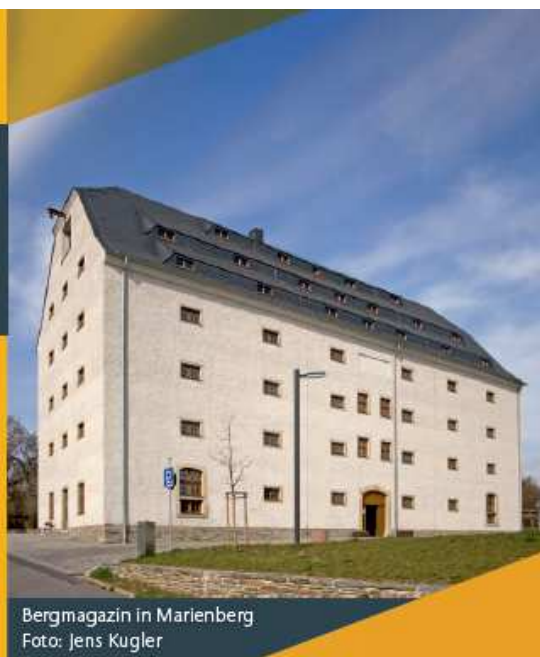
Bergmagazin in Marienberg

Ablauf: Informationen zum aktuellen Stand der UNESCO-Welterbe-Nominierung Vortrag zu „Der mittelalterliche und frühneuzeitliche Bergbau im Freiburger Zentralrevier“ Referent: Stephan Adlung Ort: Museum sächsisch-böhmisches Erzgebirge Am Kaiserteich 3, 09496 Marienberg Veranstalter: Welterbe Montanregion Erzgebirge e. V. c/o Wirtschaftsförderung Erzgebirge GmbH Ansprechpartner: Markus Link, Tel. 03733 145-124